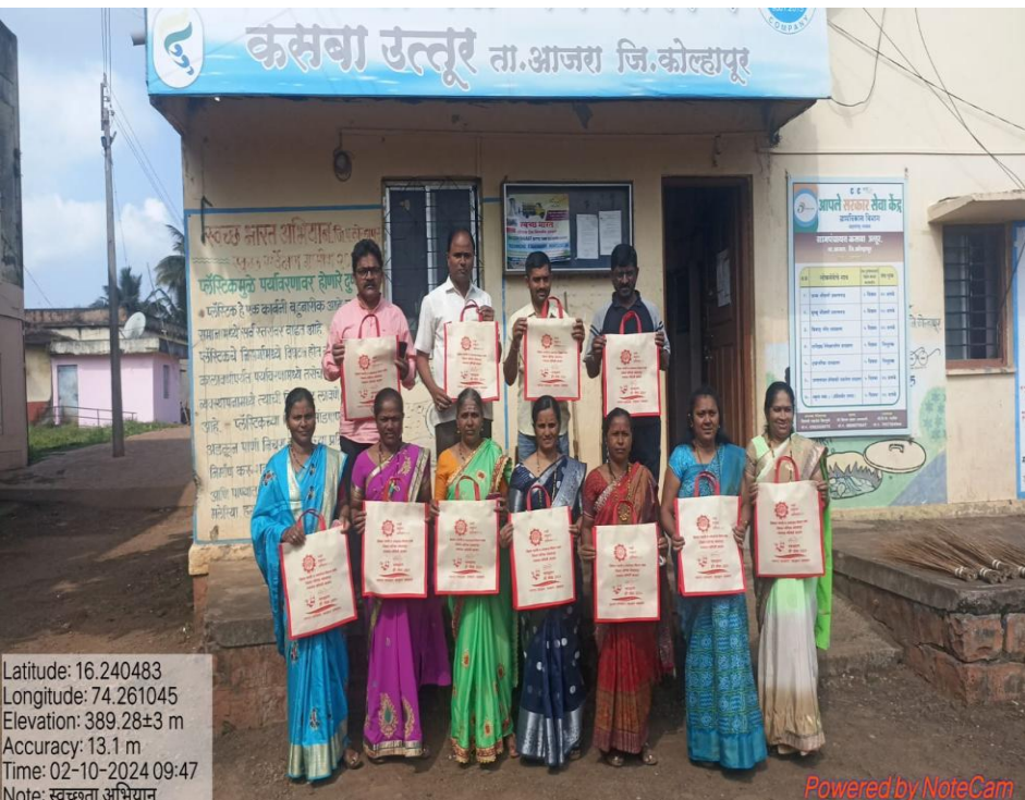
Latitude: 16.240483 Longitude: 74.261045 Elevation: 389.28±3 m Accuracy: 13.1 m Time: 02-10-2024 09:47 Note: स्वच्छता अभियान