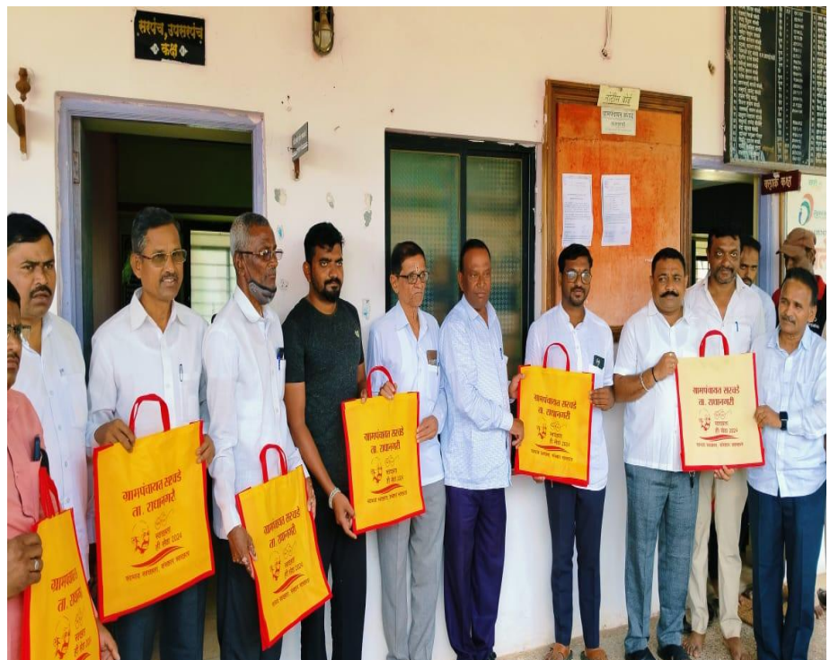
Latitude: 16.240483 Longitude: 74.261045 Elevation: 389.28±3 m Accuracy: 13.1 m Time: 02-10-2024 09:47 Note: स्वच्छता अभियान