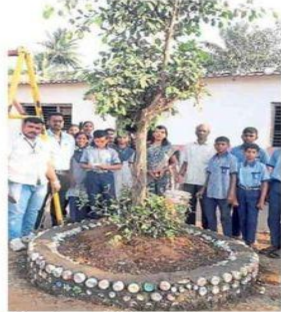
कुडिचे : राष्ट्रसेवा प्रखाला, शिरोली केंद्र नागाव येथे रिकाम्या बाटल्यांपासून झाडाभोवती तयार केलेले पारकट्टा.

■ वेस्ट टु आर्ट उपक्रम सर्व शाळांमध्ये राबविण्यात येईल. वापरत नसलेल्या वस्तूंचा पुनर्वापर करून विद्यार्थ्यांनी नावीन्यपूर्ण कल्पनातून टिकाऊ वस्तूंची निर्मिती करण्यात येणार आहे. यामध्ये उत्कृष्ट आणि नावीन्यपूर्ण असलेल्या प्रत्येक तालुक्यातील पाच वस्तू जिल्हास्तरावर सादर केल्या जाणार आहेत. यामध्ये वस्तूवर विद्यार्थ्यांचे नाव, शाळेचे नाव नोंद करून या वस्तू जिल्हास्तरावर कार्यालयात प्रदर्शनासाठी ठेवण्यात येतील.