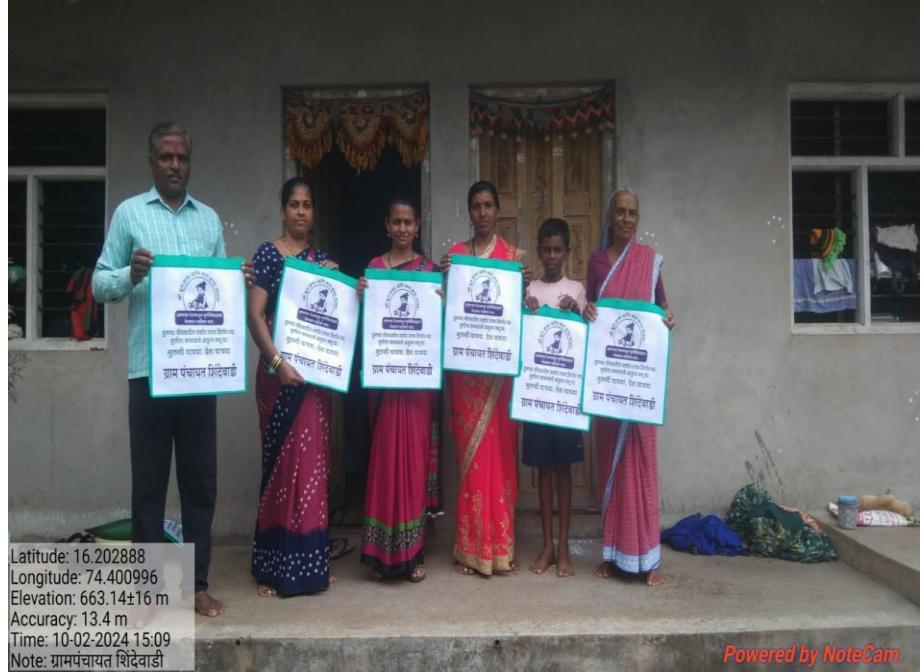
Latitude: 16.202888 Longitude: 74.400996 Elevation: 663.14±16 m Accuracy: 13.4 m Time: 10-02-2024 15:09 Note: ग्रामपंचायत शिदेवाडी